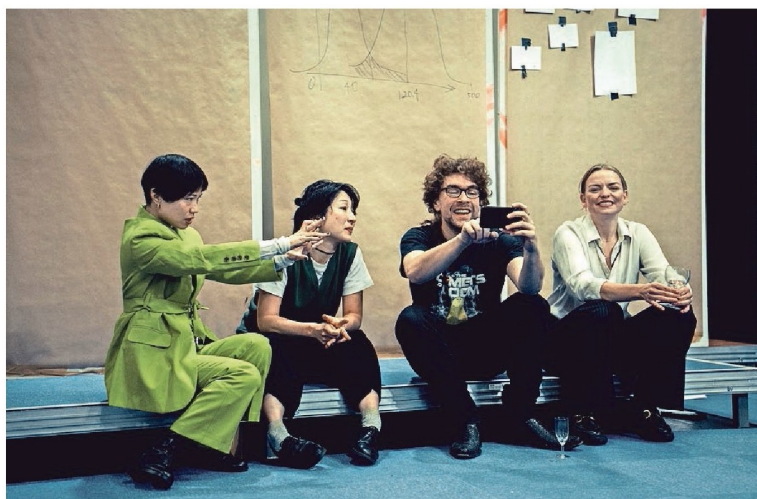
Repetitie van Superposition .

Natuurlijk is niet elke Japanner perfectionistisch of elke Nederlander direct. Een stereotype is een gemiddelde