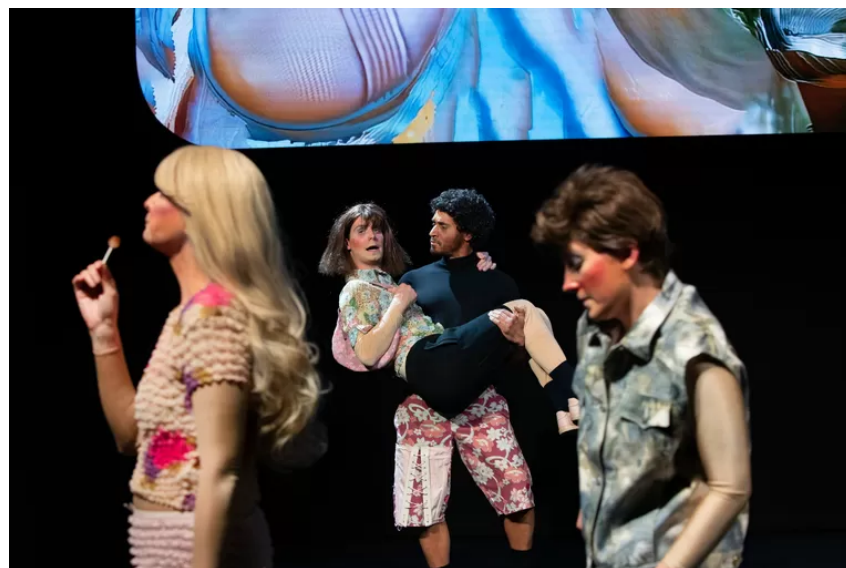
'Dieven' van Toneelschuur Producties.